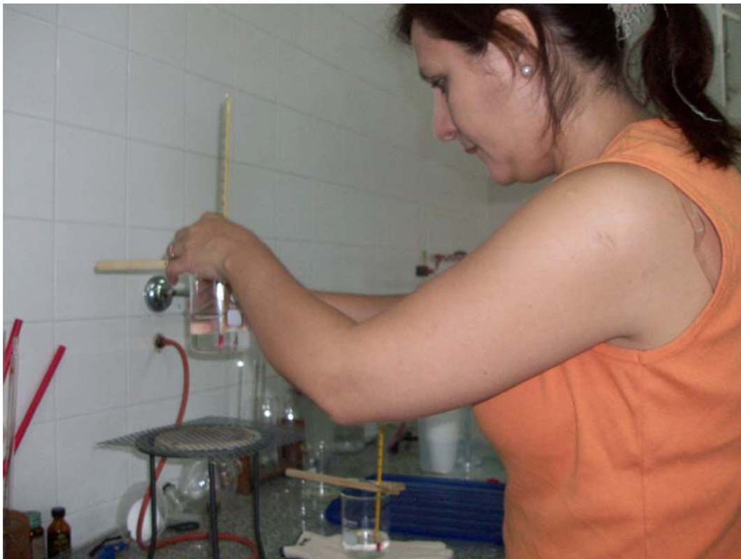
Figura 2: Taller de Termómetros, Calor y Temperatura - Jornadas organizadas con el Ministerio de Educación de la Provincia de Buenos Aires, La Plata 5 de diciembre de 2008.