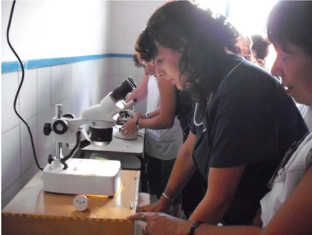
Figura 1: Taller de Microscopio y Lupa Binocular - Jornadas organizadas con el Ministerio de Educación de la Provincia de Buenos Aires, La Plata 5 de diciembre de 2008.