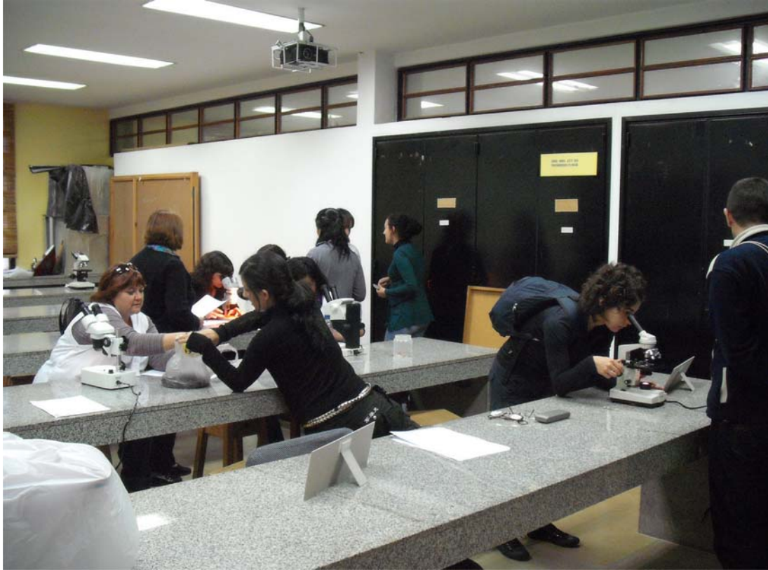
Figura 5: "La Universidad en el Bicentenario", Jornadas de Extensión Universitaria en el marco de los festejos por el Bicentenario de la República – Facultad de Ciencias Naturales y Museo de la UNLP, La Plata 18 de octubre de 2010.