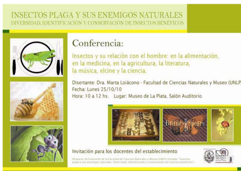
Figura 2. Anuncio de la charla-taller brindada en el Museo de La Plata.