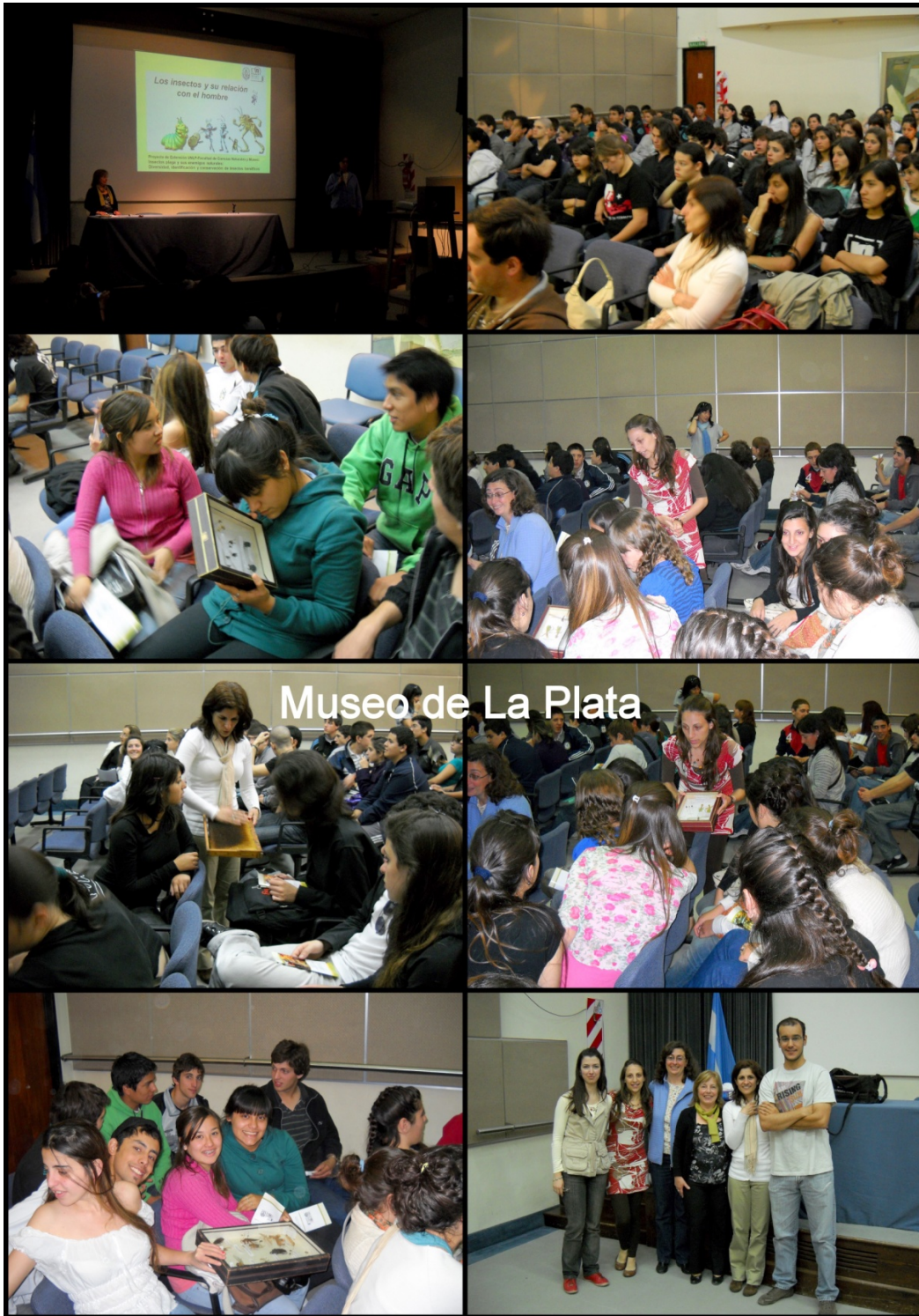
Figura 3. Charla-taller dictada en el Auditorio del Museo de la Plata para los alumnos de la EEM N°33 y 34 y del Instituto Juan XXIII con la participación de integrantes del equipo de trabajo.