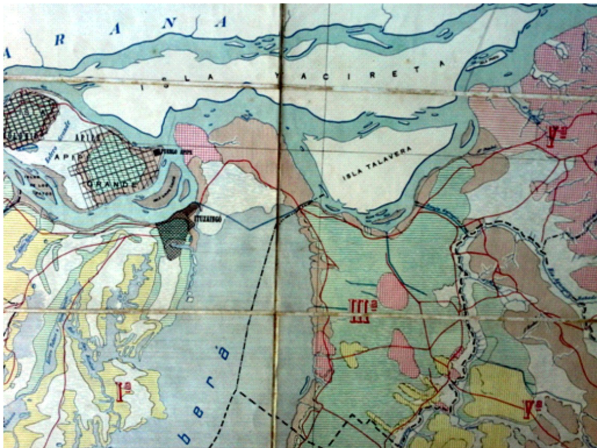
Figura 2. Geología de la zona de Ituzaingó hasta el límite con Misiones.

El segundo tomo está dedicado a temas vinculados con la cartografía y la división política vigente para los departamentos en que se dividía la provincia.