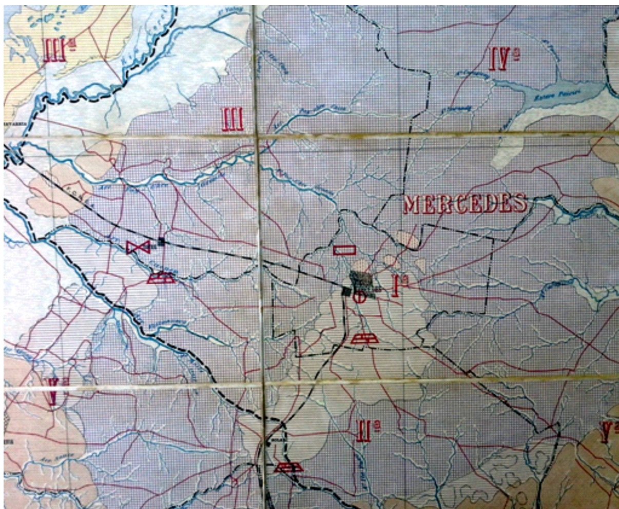
Figura 4. Mapa del entorno de la ciudad de Mercedes.

Si bien la expresión cartográfica de las diferentes unidades no se compatibilizaba con la que años antes había desarrollado en otras partes del país, el resultado fue lo suficientemente claro y preciso para dar cumplimiento con lo requerido por las autoridades correntinas. Sirvan estas referencias para señalar la calidad científica de este grande de la geología argentina.