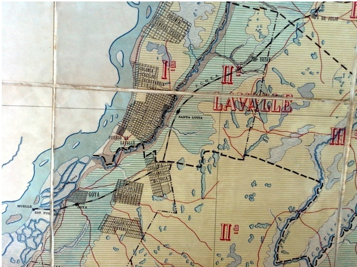
Figura 3. Geología de la zona de Goya y alrededores.

los departamentos de Santo Tomé, San Martín y Paso de los Libres y corresponde al lavado de lateritas. Se los considera adecuados para el laboreo.