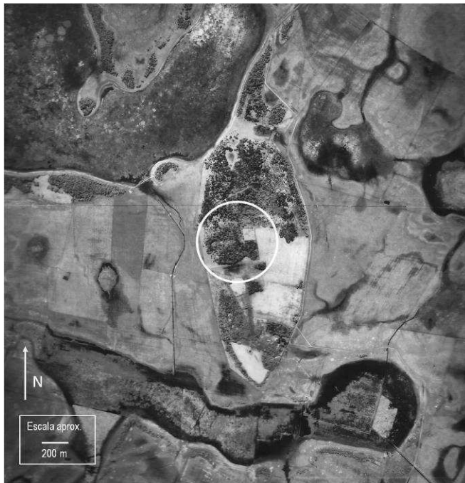
Figura 3. Detalle del Fotograma C 1189-50 (13-08-1984) del Ministerio de Obras Públicas, Provincia de Buenos Aires. El círculo indica el sector donde se localizan las ruinas del segundo asentamiento de la Reducción “Nuestra Señora de los Indios Pampas”.