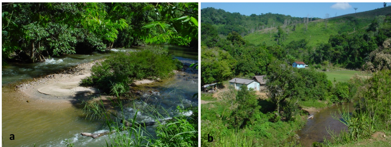
Figura 3. a. Geoindicadores arqueológicos comuns na bacia do Rio Ribeira de Iguape: cascalheiras e corredeiras e b. Sítio dos Coelhos (Apiá, Estado de São Paulo): sítio lítico em terraço fluvial. Ocupa o mesmo lugar da casa atual.

Lima (2005) estudou o sítio Capelinha 1, situado no município de Cajati (SP). O Capelinha 1, identificado como um sambaqui fluvial em uma área com grande densidade de sítios deste tipo, apresentou uma indústria lítica associada à tradição Umbu e, segundo Lima (2005), esta indústria inserida em uma matriz conchífera contribuiu para a indefinição da natureza cultural do sítio e torna difícil relacioná-lo ao contexto arqueológico regional. Apesar dele destoar dos outros sítios líticos de tradição Umbu localizados até então na região, bem mais recentes e estudados por DeBlasis (1988, 1996), talvez estes tenham características bastante peculiares influenciadas pelo ambiente do médio vale do rio Ribeira de Iguape. A diversidade e a amplitude cronológica dos sítios líticos desta área parecem ser maiores.