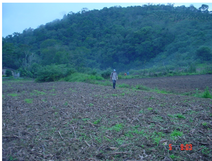
Figura 4. Sítio Ponta Grossa (Cerro Azul, Paraná): sítio cerâmico da tradição Itararé-Taquara localizado na vertente. Em primeiro plano: Gustavo Neves de Souza.

De 2001 a 2005, foram localizados vários sítios na bacia do rio Ribeira de Iguape (São Paulo e Paraná) durante as pesquisas do patrimônio arqueológico ligado a uma Linha de Transmissão de Energia (Morais 2005). Cabe destacar 3 sítios cerâmicos, filiados à tradição Itararé-Taquara, Ponta Grossa e Estrela e a casa subterrânea Ponta Grossa 2, todos localizados no município de Cerro Azul, Paraná. O sítio Ponta Grossa apresentou muitos materiais cerâmicos e líticos (em menor quantidade) na superfície e 1 lâmina de machado polida; após caminhamento e intervenções subsuperficiais, notou-se que a aldeia se restringe à área mais aplainada na média vertente (Figura 4). O sítio Ponta Grossa 2 foi localizado do outro lado do rio, na margem direita do rio Ponta Grossa e identificado como uma casa subterrânea: trata-se de uma bacia com material orgânico no fundo, vestígios líticos e um buraco de esteio. O sítio Estrela foi objeto de coleta superficial de fragmentos cerâmicos da tradição Itararé-Taquara, algumas cerâmicas decoradas da tradição Tupiguarani e várias peças líticas lascadas. Um fragmento de cerâmica da tradição Itararé-Taquara foi datado por termoluminescência e obtida a data 1.500 \pm 180 (amostra 1417, FATEC).