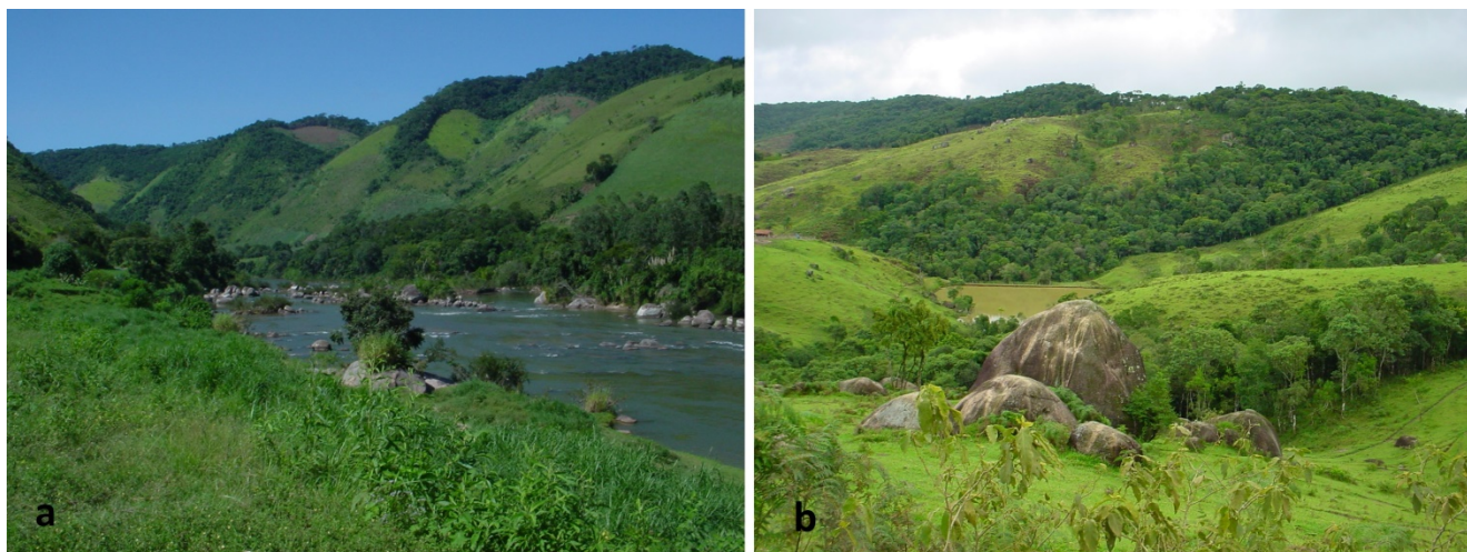
Figura 2. a. Rio Ribeira de Iguape, Estado do Paraná, próximo à fronteira com o Estado de São Paulo e b. Rio Ribeira de Iguape, estrada entre Apiaí e Ribeirão Branco (SP).

Segundo Suguio e Tessler (1992), a bacia do rio Ribeira de Iguape desempenhou importante função nos processos evolutivos da região durante o Quaternário. Para Ross (2002), o relevo desta bacia apresenta macrocompartimentos geomorfológicos muito distintos, que correspondem aos morros da superfície de cimeira regional, os morros fortemente dissecados dos níveis intermediários da Serra do Mar, as terras da depressão tectônica do baixo Ribeira e a planície costeira marinha e fluvial. Para este autor, a conjugação de processos tectônicos e os mecânicos e químicos das águas ao longo de milhões de anos definem as morfologias atuais do relevo e dos sistemas ambientais desta bacia.