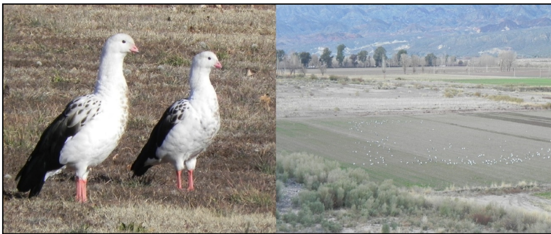
Figura 2. Grupo de dos ejemplares (izquierda) y vista parcial de la bandada de 390 individuos de Guayata (derecha) en proximidades de Barreal y Tamberías, respectivamente, en el valle de Calingasta.

El modelo que mejor ajustó a la distribución de las distancias perpendiculares registradas fue el Half normal con un AIC= 191,3. En un contexto de alta variabilidad en el tamaño de las bandadas observadas (rango= 2-390) (Figura 2), el ancho de la faja de detección fue de 601 m, la densidad de bandadas resultó de 0,23 ( \pm 0,09) por km 2 (IC 95 %= 0,08-0,68), la densidad de Guayatas alcanzó el valor de 98 ( \pm 56) por km 2 (IC 95 %= 10,9-872,4), en tanto que el total de Guayatas en el valle se estimó en 3500 ( \pm 2000) ejemplares (IC 95 %= 390-31000).