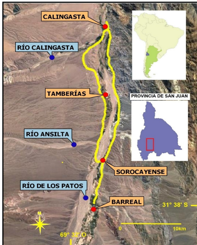
Figura 1. Localización del valle de Calingasta (rectángulo rojo en la provincia de San Juan) y principales poblados y accidentes geográficos de la zona. La línea continua amarilla indica el recorrido realizado.

de los establecimientos agrícolas en el valle corresponden a pequeñas explotaciones familiares destinadas a forestaciones con salicáceas, frutales (como manzanos y nogales) y finalmente forrajeras y cultivos anuales o herbáceos (como aromáticas) (Van den Bosch, 2008).