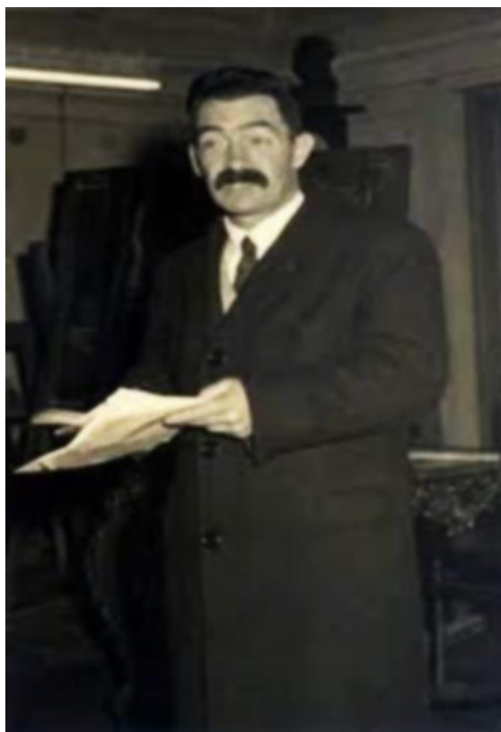
Figura 3. Raúl A. Ringuelet.

El trabajo es coronado con una bibliografía actualizada al momento de su publicación, mapas de las áreas en estudio, y una serie de imágenes fotográficas de peces, acompañadas por dibujos de Edmundo Maristany, Luis Tremoullies, Francisco Vecchioli y la curiosidad de un dibujo del género Rhamdia realizado por el destacado zoólogo y paleontólogo Dr. Ángel Cabrera (Fig. 4).