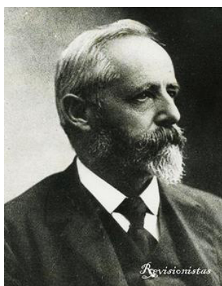
Figura 11. Santiago Roth.