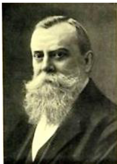
Figura 8. Fernand Lahille.