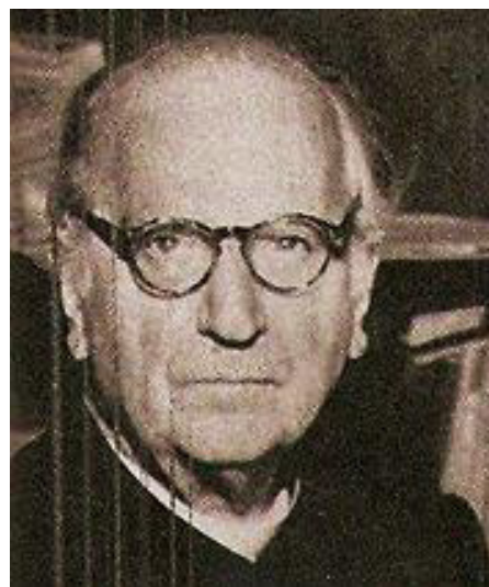
Figura 7. Guillermo Furlong.