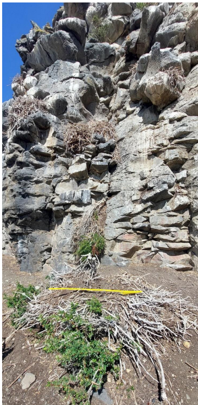
Figura 3. Nido de bandurria caído hecho con ramas de calafate ( Berberis sp.) disponibles en los alrededores inmediatos en el cañadón del Puesto Verde, curso medio del río Gallegos. La escala es de 1 m. Nótese la profusión de nidos en el farallón de basalto.

solían comer crudas (Musters, 1964 [1871], p. 131; Priegue, 2006, p. 39; Vignati, 1939, p. 510). Greenwood “supped on raw meat” (cené con carne cruda) en invierno del siglo XIX e informa cómo se vio obligado a comer carne cruda de halcón (Greenwood, 2015, pp. 95-96) 3 . En este sentido, la ingestión de carne cruda para sobrevivir también ha sido registrada entre exploradores europeos en los canales fueguinos (Canclini, 1959) y en otros ambientes (Borrero, 2023). Debe mencionarse que la preparación e ingesta de carne, grasa y pescado fermentado pudieron suplir a su cocción (Speth, 2017), destacando que el valor nutritivo de la carne y la grasa de animales muertos por frío u otras causas se extiende por muchos meses, hasta el punto de seguir siendo consumible en verano. Estos casos aluden a condiciones experimentadas por gente en movimiento, donde un cierto grado de oportunismo es esperable. Interesa destacar su factibilidad, aunque no debieron ser condiciones usuales en invierno.