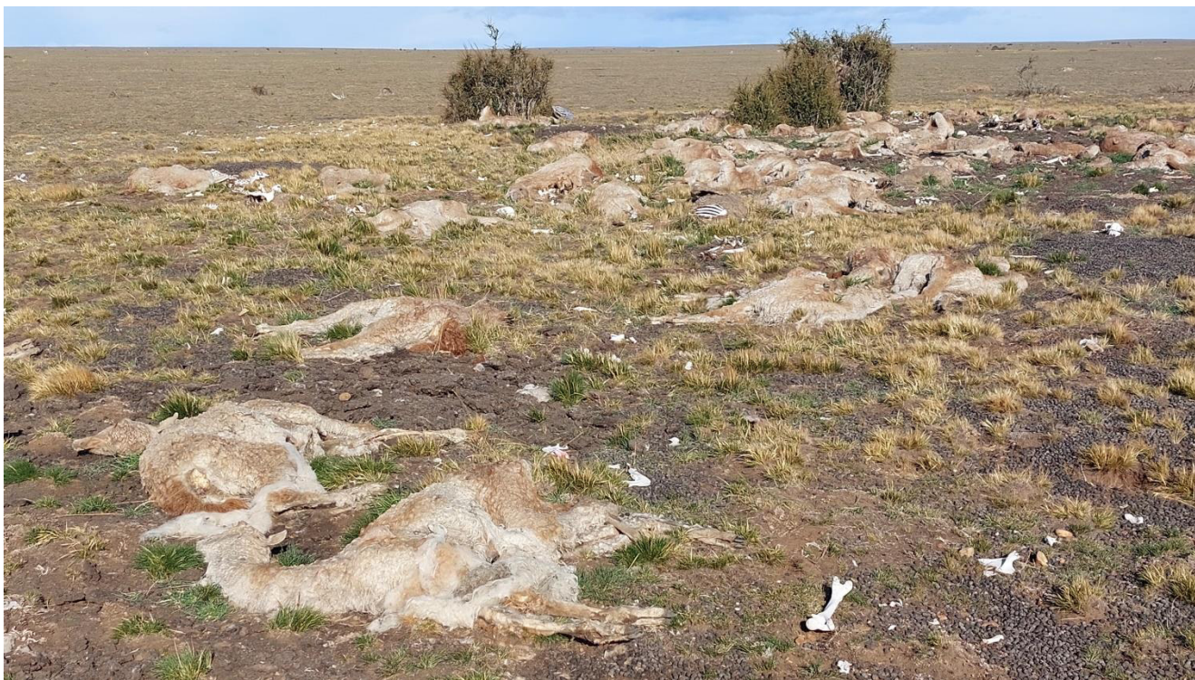
Figura 4. Concentración de guanacos muertos por estrés invernal en las planicies aterrazadas (~ 200 m s.n.m.) del interfluvio Coyle-Gallegos.

Este escenario corresponde a cazadores instalados en un campamento, pero tanto los costos como la necesidad pueden variar para cazadores en marcha, situación planteable en tiempos de exploración inicial de la región. Las tácticas postulables para cazar o encontrar carcasas bajo la nieve son múltiples. Bordes & Thibault (1977) y Gamble (1987) ejemplifican el potencial de las carcasas congeladas para la colonización de Europa en tiempos glaciales, lo cual también es válido en Patagonia (Borrero, 2023). Gamble sugirió el uso potencial de los instrumentos puntiagudos recuperados en Clacton y Lehringen, a los que se pueden agregar los recuperados en Schoeningen (Allington-Jones, 2015; Gamble, 1987; ver Speth, 2018, p. 165 para alternativas) a modo de pértigas para encontrar carcasas, como las que se usan para buscar a individuos atrapados en avalanchas de