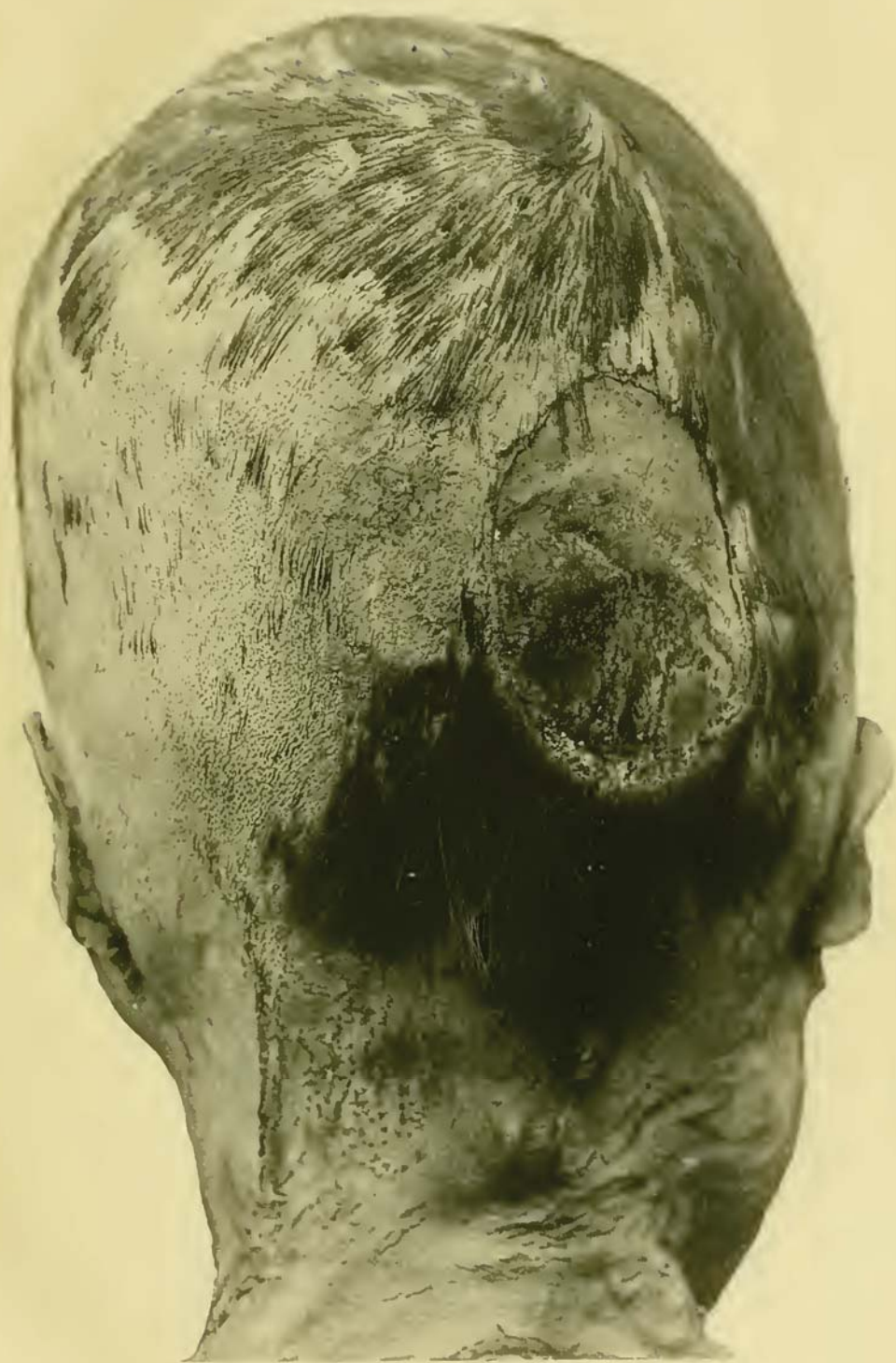
Tête perforée d'une momie bolivienne, conservée au Musée de La Plata

(vue de derrière, \frac{3}{4} grandeur naturelle)