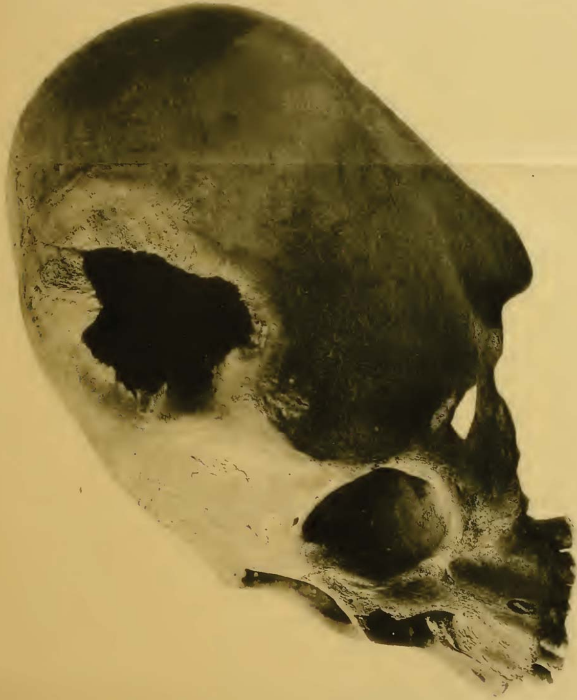
Crâne péruvien trépané. conservé au Musée National de Buenos Aires (grandeur naturelle)