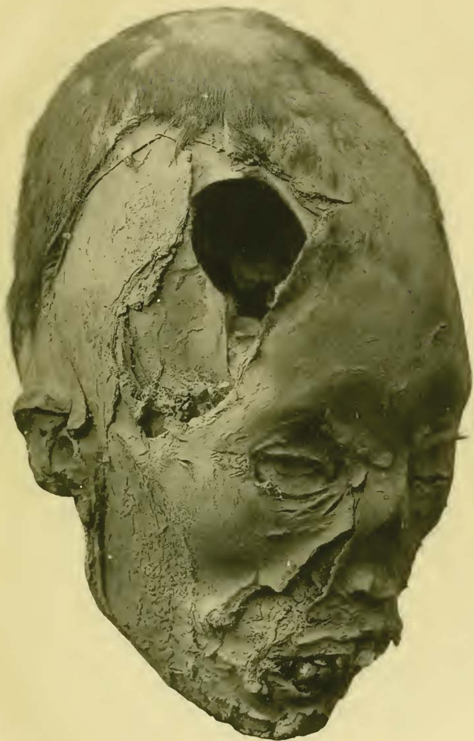
Tête perforée d'une momie bolivienne, conservée au Musée de La Plata

(vue de devant, \frac{3}{4} grandeur naturelle)