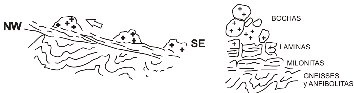
Figura 3. Esquema de la zona del granito “El Renegado” en zona granitizada.

En 2008, en relación con el Granito “El Renegado”, se detectó una zona granitizada con decenas de cerros graníticos, con rocas pre tectónicas, sin-tectónicas y post-tectónicas, las que constituían los restos de una escama tectónica granítica con vergencia al noroeste (Fig. 3). Esto obliga a repensar la necesidad imperiosa de cartas geológicas detalladas y estudios por geólogos especialistas, antes de someter las rocas a análisis y usar relaciones geoquímicas para clasificar y tipificar granito-génesis.