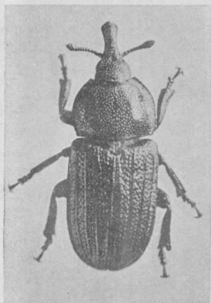
Oxycozynus parvulus Bruch (8 × aumentado)

Las antenas son espesas, algo más cortas que el rostro; el segundo artículo es subgloboso, el tercero algo más ancho que largo, los siguientes netamente transversales, disminuyendo de largo y aumentando de