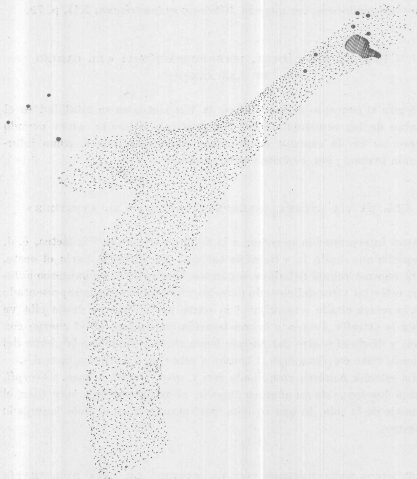
Fig. 2. — « El Avestruz lacteal ». Ver el texto

chacho entonces fué a quejarse a su madre, pero ella lo retó. Fué entonces a contarlo a su padre, el dueño de la noche. Éste se enojó y mandó a su mujer preparar un hilo muy largo 1 , de caraguatá, que alcanzara hasta una laguna distante tres cuadras. La mujer juntó muchas fibras, hizo el hilo y avisó al marido cuando todo estaba listo. El marido en-