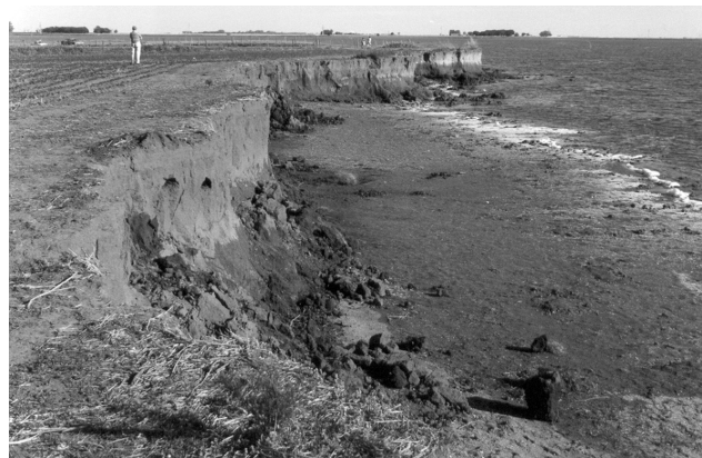
Figura 2. Barranca noreste de la laguna El Doce.

La laguna El Doce se origina entonces a partir de una antigua hoya de deflación excavada durante el último período climático árido, donde además se formaron dunas eólicas en sus márgenes (Iriondo 1987). Estas dunas hoy conforman topográficamente el sector más alto de este ambiente lagunar y es donde se ubica el mencionado sitio (Figura 2).