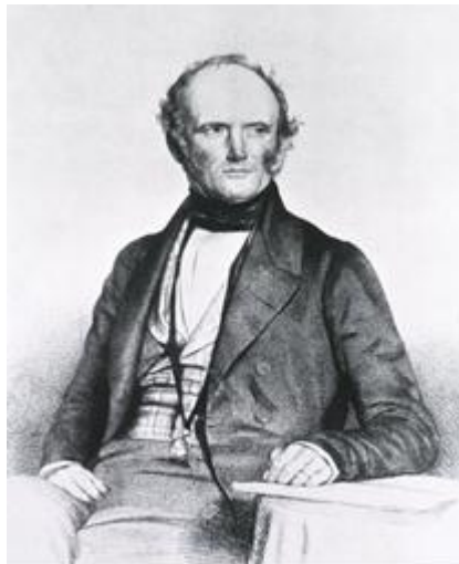
Figura 2. Charles Lyell (1797 – 1875)

Es en este contexto que Charles Lyell, sobre la base de sus observaciones geológicas tomó como marco teórico explicativo el concepto del gradualismo, el cual expuso en su obra “ Principios de Geología ”, subtitulada “un intento de explicar los cambios que han ocurrido en la superficie de la Tierra por causas operantes en la actualidad”, en la cual aceptaba como básica la uniformidad de la naturaleza, excluía la existencia de agentes supranaturales y establecía la autonomía de la ciencia. El gradualismo de Lyell sin embargo comprendía dos principios diferentes: el del Actualismo , según el cual los procesos que actuaron en el pasado son los mismos que actúan en el presente, y el de la Uniformidad , según el cual la intensidad y velocidad de los procesos actuantes durante la historia de la Tierra no han variado a través del tiempo. Hoy en día sabemos que el primero es una expresión de dos principios generales de la Ciencia, el de Legalidad y el de Simplicidad, y que el segundo es falso.