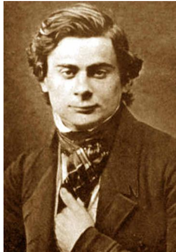
Figura 5. Thomas Henry Huxley (1825-1895)

Sin embargo otros científicos no aceptaron la teoría de buen grado. Tal el caso de su antiguo profesor de geología Sedgwick, cuyos comentarios incluidos en una carta de fines de 1859, deben haber sido dolorosos para Darwin considerando la fuerte impresión que aquel le había causado en su juventud.