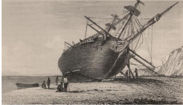
Figura 3. El “Beagle” en Santa Cruz

Entre 1832 y 1834 Darwin visitó numerosos lugares de la Argentina: Punta Alta, cerca de Bahía Blanca, el canal de Beagle y Tierra del Fuego, Las islas Malvinas, Puerto Deseado y San Julián, las barrancas del Paraná hasta Santa Fe, y recorrió a caballo el trayecto entre Carmen de Patagones y Buenos Aires. Entre el 13 de abril y el 4 de mayo de 1834, Fitz Roy, Darwin y parte de la tripulación intentaron remontar en bote el río Santa Cruz hasta sus fuentes, pero fracasaron a solo pocos kilómetros del lago que le da origen y a la vista de los cerros que lo circundan, que Fitz Roy llamó Hobler y Castillo. Más de cuarenta años después, en 1877, sería el Perito Moreno quien haciendo el mismo recorrido llegaría al lago que llamaría “Argentino”.