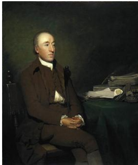
Figura 1. James Hutton (1726 – 1797)

La idea de Hutton de que los cambios ocurridos en la corteza terrestre se deben a los procesos naturales que se observan hoy día lo llevo a suponer la existencia de ciclos de duración indefinida y a afirmar en consecuencia que no se observan en la naturaleza ni vestigios de un origen ni perspectivas de un final. En sus ideas se integraban una concepción de la Tierra acorde, por un lado con el ordenamiento Newtoniano del Universo y con la mecánica de una maquina de vapor como la inventada por su amigo Watt y por otro con ciclos de renovación similares a los provistos por el sistema circulatorio de Harvey. La prueba crucial de que la superficie terrestre fue moldeada por ciclos de erosión, consolidación y levantamiento la halló Hutton en la región de Siccar Point, Escocia, donde la formación de las diferentes rocas del Paleozoico y la discordancia que las separa dan testimonio de los diferentes procesos ocurridos y de los vastos tiempos involucrados en ellos.