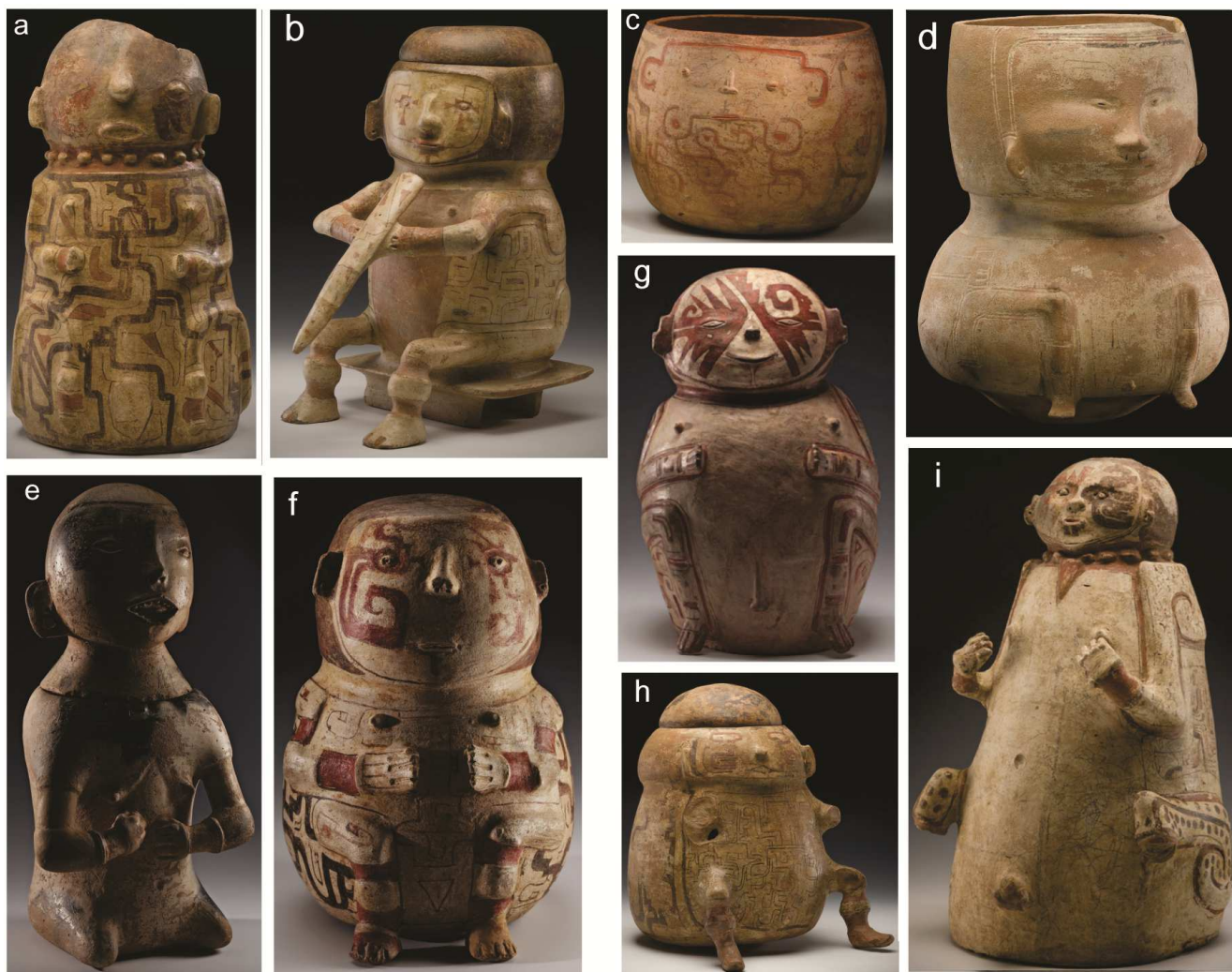
Figura 5. Colección CICAME-MACCO. Urnas funerarias antropomorfas. Dimensiones: a. alto: 41 cm, diámetro: 22 cm; b. alto: 37.5, diámetro: 21.5 cm; c. alto: 23 cm, diámetro: 24 cm; d. alto: 42 cm, diámetro: 32 cm; e. alto: 65.5 cm, diámetro: 25 cm; f. alto: 22 cm, diámetro: 32 cm; g. alto: 49 cm, diámetro: 31 cm; h. alto: 34 cm, diámetro: 30 cm y i. alto: 40 cm (aprox.); diámetro: 20 cm (aprox.).