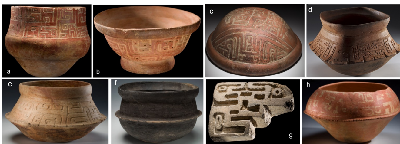
Figura 4. Colección CICAME-MACCO. Ollas, cuencos, y sello. Dimensiones: a. alto 31 cm, diámetro 37 cm; b. alto 8 cm, diámetro 23.5 cm; c. alto 9 cm, diámetro 28 cm; d. alto 17 cm, diámetro 23 cm; e. alto 17 cm, diámetro 29.5 cm; f. alto 18 cm, diámetro 29 cm; g. largo 9 cm, ancho 5.5 cm; h. alto: 9 cm, diámetro: 29 cm.

Además de estos modelos de composición 'abstracta', se registran también hallazgos de platos decorados con representaciones naturalistas de ofidios, en los cuales la decoración pintada replica con absoluto realismo el patrón característico de la piel de la Boa constrictor . En uno de ellos (Figura 3a) es interesante observar que la decoración naturalista de la piel de la misma, que se desenrolla en espiral desde el centro del plato, es acompañada por un campo decorativo formado por polígonos irregulares ejecutados en línea fina (Modelo I). El énfasis sobre la figuración de ofidios en la decoración cerámica Napo ciertamente recuerda a otros conjuntos cerámicos de la Tradición Polícroma de la Amazonía (Schaan 2001; Barreto 2008). Ortiz de Villalba (1987, p. 14) registra la relevancia de estos motivos entre las actuales ceramistas Kichwa-hablantes del Napo ecuatoriano: "Los dibujos más bonitos son el motelo y la pishcu amarum (boa arco iris). Con estos dibujos cualquier cosa se ve bonita". La boa arco iris y la anaconda ocupan un lugar fundamental en las cosmovisiones de tierras bajas (Roe 1982; Gebhart-Sayer 1985; Sullivan 1988).