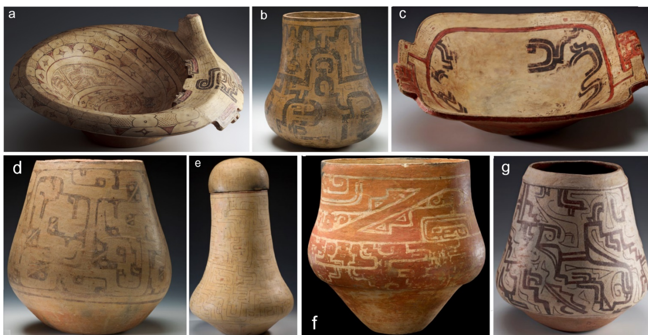
Figura 3. Colección CICAME-MACCO. Platos y urnas funerarias no antropomorfas. Dimensiones: a. alto 12 cm, diámetro 39 cm; b. alto 34 cm, diámetro 36 cm; c. alto 9.5 cm, diámetro 36.5 cm; d. alto 36 cm, diámetro 31 cm; e. alto 44.5 cm, diámetro 32 cm; f. alto 35.5 cm, diámetro 35 cm y g. alto 24 cm, diámetro 27 cm.

rectilíneos y curvilíneos de ejecución firme, formados por bandas anchas o líneas finas, pintadas simples o dobles, cuyos trazos ocasionalmente se entrecruzan. A manera de ‘líneas de forma’ (Holm 1965), dichos trazos (que a veces son estilizadas de diferentes maneras, tal que algunos detalles sugieren figuración zoomórfica) enmarcan el espacio para la ejecución de diversos elementos, incluyendo motivos abstractos ejecutados con trazo fino, polígonos en línea fina, volutas, líneas formadas por puntos, puntillado, y motivos en cruz. Estos motivos ciertamente constituyen un extenso vocabulario iconográfico (Viteri Toledo 2019), que podrían sugerir la estilización de fosfenos (Reichel-Dolmatoff 1978), reflejar motivos que hasta recientemente eran empleados en la pintura facial de grupos de la Amazonia occidental (Langdon 1992), o representar zoomorfos estilizados como fetos de caimanes y de culebras (Ortiz de Villalba 1981; Palacio 1989; Cabodevilla 1998). Las composiciones del Modelo I pueden ser pseudo-especulares o de representación desdoblada (Figura 5a), produciendo la sensación de simetría sobre el eje vertical, aun cuando los patrones completamente simétricos en este modelo de composición son escasos.