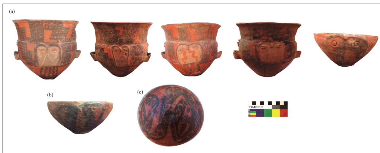
Figura 3. Representaciones de lechuzas en los materiales relevados de las Colecciones: (a) Quintar; (b) Pereyra y (c) Bayón.