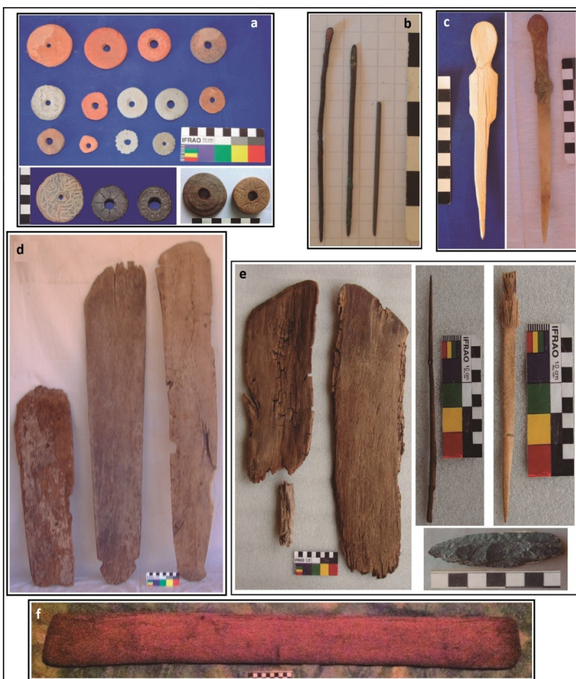
Figura 2. Evidencias indirectas de producción textil documentadas en las colecciones y conjuntos de objetos producto del accionar de pobladores locales: (a) torteros de cerámica, roca y madera –Colección Pereira y Pereyra–; (b) agujas de metal –Colección Pereira–; (c) Separadores de hilos óseos –Colección Pereira y Bayón–; (d) y (f) palas de tejedor – Colección Bayón y Nieto–; (e) palas de tejedor, aguja, separador y cortador de fibras –Conjunto del entierro LP-II–.