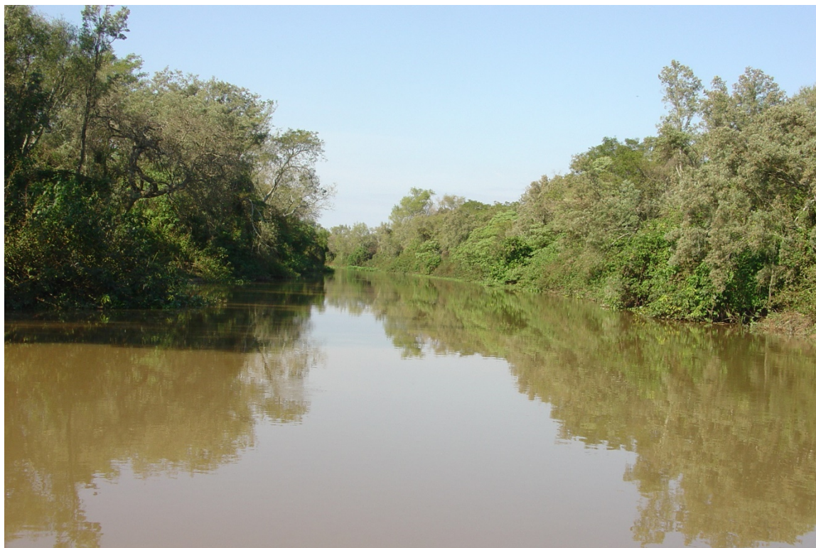
Figura 3. Delta Superior del río Paraná.