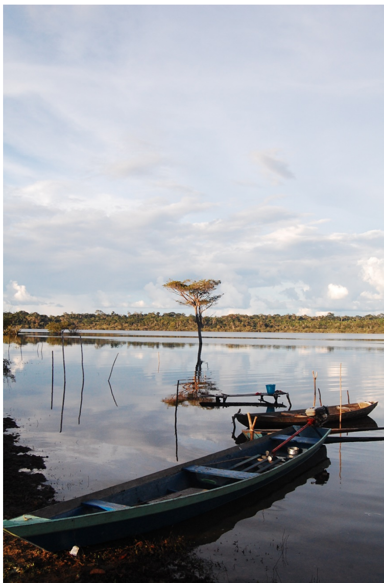
Figura 2. Río Maués afluente del río Amazonas en la Amazonía central.