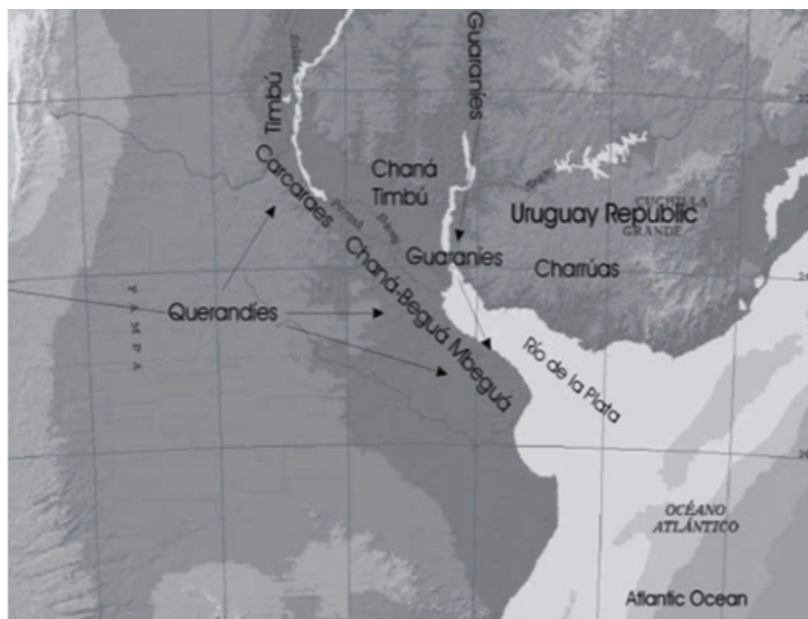
Figura 2: Distribución de los grupos étnicos que habitaron el humedal del Paraná inferior en el siglo XVI. Modificado de Loponte (2008).

cuales los guaraníes sometían o asimilaban a otros grupos étnicos. Los grupos cazadores-recolectores que habitaban el área previamente, parecen haber tenido resistencia al avance guaraní y es probable que se haya incrementado la competencia por los espacios productivos. Los cronistas europeos mencionan que la pesca y la caza eran importantes para estos grupos migrantes, un hecho que se evidencia en los sitios por su arqueofauna. A la llegada de los colonos españoles, se encontraban habitando el área diversas comunidades locales cazadoras-recolectoras (Fig.2) como los timbúes, chaná, chaná-beguá, chaná-timbú, mbeguá y carcaraes, además de poblaciones horticultoras guaraníes (Loponte, 2008; Bonomo et al. , 2011; Acosta & Loponte, 2013).