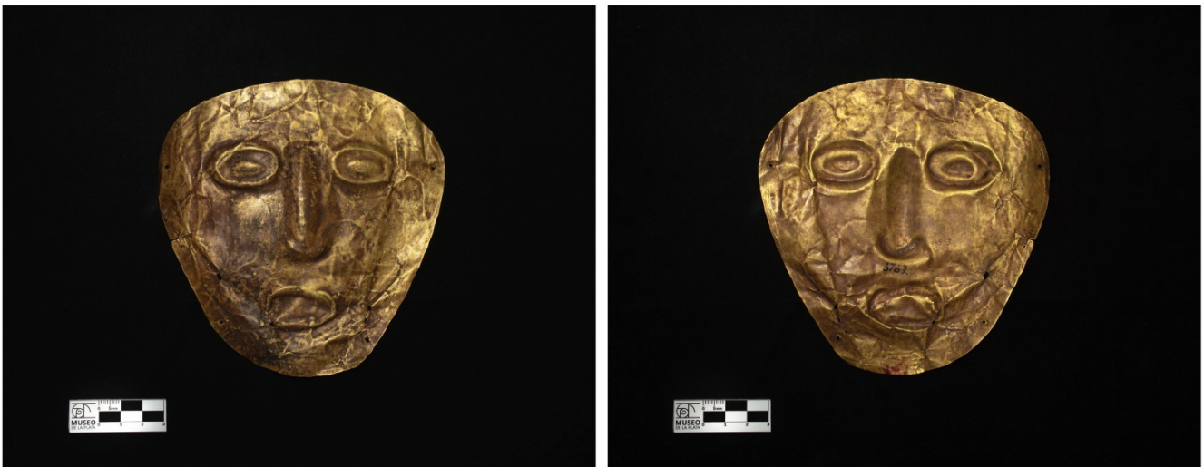
Figura 1. Ejemplo del resultado esperado

Por último, y con el fin de obtener una buena nitidez en todos los puntos de la superficie de la pieza fotografiada, se debe buscar una amplia profundidad de campo, lo cual se logra con un número f alto (diafragma cerrado) y una distancia focal no muy larga (Hecht, 1977). Esto puede ser dificultoso de lograr en condiciones de escasa iluminación y para objetos voluminosos como puede ser una vasija, por lo cual se destaca la importancia de contar con una buena potencia de luz. Sin embargo, para algunas piezas puede ser ventajoso utilizar una profundidad de campo menor con el fin de resaltar el volumen de la pieza dando prioridad a la nitidez de la porción frontal según la norma elegida, en cuyo caso es importante que la escala se encuentre colocada a la misma distancia que la parte nítida de la pieza, es decir, en el mismo plano focal.