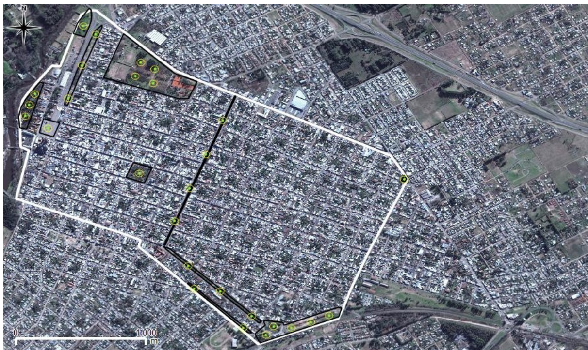
Figura 1. Imagen del área de estudio en el casco urbano de la localidad de Luján del partido homónimo, provincia de Buenos Aires. La línea blanca indica la delimitación del barrio Centro, las áreas sombreadas delimitadas por una línea negra indican las áreas verdes urbanas, los puntos amarillos indican los puntos de muestreo dentro de las áreas verdes.

Las especies registradas fueron clasificadas según su frecuencia de aparición entre las AVU muestreadas: aquellas observadas en al menos el 80% de las AVU se las categorizó como “frecuencia alta” y aquellas observadas en menos el 30% de las AVU como “frecuencia baja”.