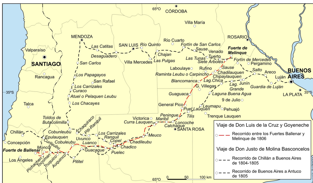
Figura 2. Recorrido de los viajes de Don Justo de Molina Basconcelos entre 1804 y 1805 y Don Luis de la Cruz y Goyeneche en 1806 (basado en Mollo & Della Mattia, 2009).

Luis de la Cruz finalmente se trasladó a Buenos Aires llegando el 16 de agosto (Canals Frau, 1937), en medio de los disturbios de la reconquista que culminarían el 20 de agosto con la rendición de Beresford y la capitulación de los ingleses. Allí hizo entrega del diario con el nuevo derrotero del camino recorrido a las autoridades del Cabildo, documento que más tarde publicaría De Angelis (1836). Sin embargo el Cabildo en ese momento decidió no hacer pública esta información, por temor a que cayese en manos de los enemigos ante una eventual nueva invasión (Acuerdos del Extinguido Cabildo de Buenos Aires, 1926).