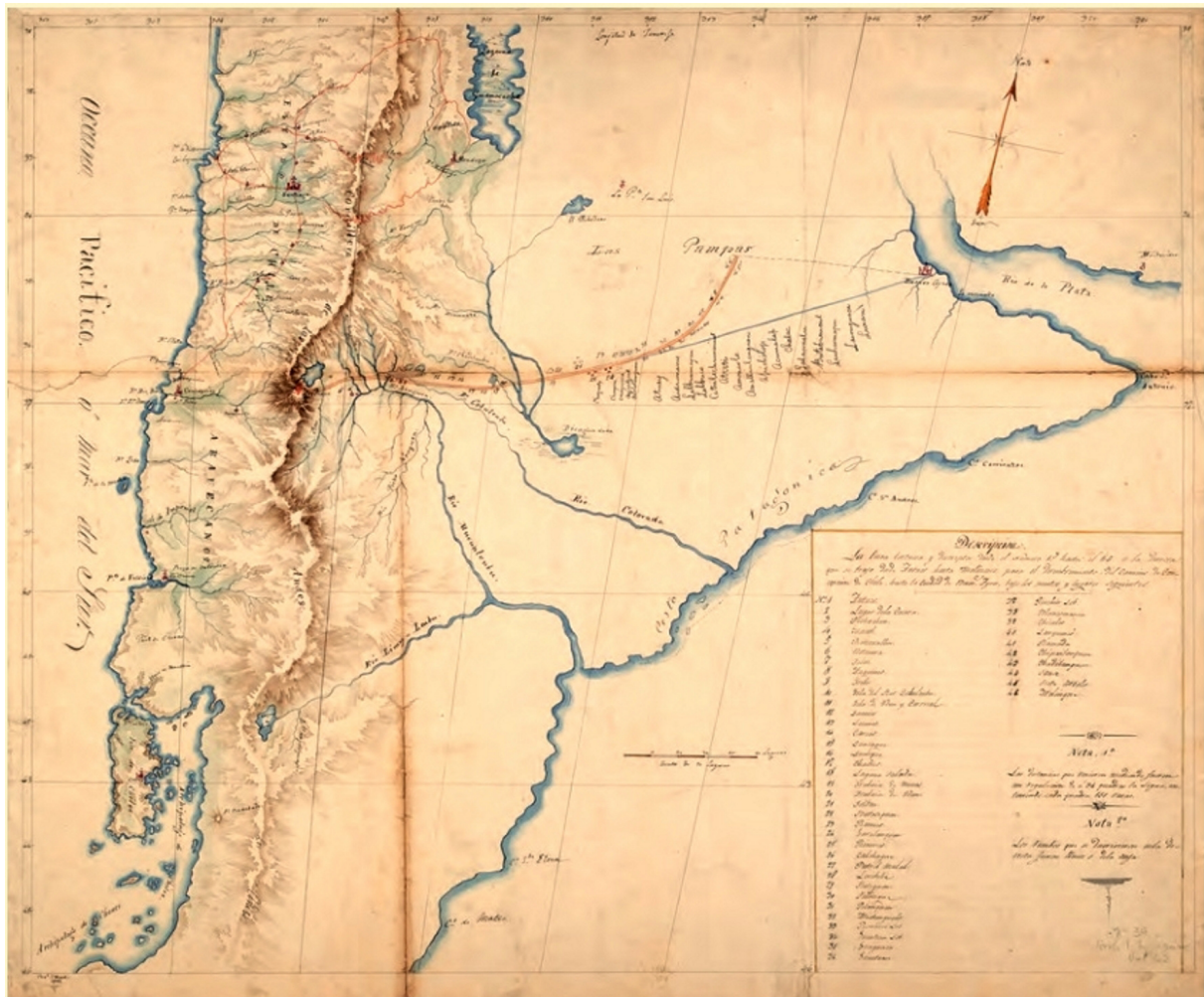
Figura 1. Mapa levantado por Luis de la Cruz y Goyeneche en 1806 y entregado con parte de su diario a las autoridades coloniales (Archivo Histórico Nacional de Chile. Mapa N° 224. Fondo: Varios. Volumen 934. Foja 232).

población de Antuco. La tercera es la expedición de Luis de la Cruz y Goyeneche en 1806, motivo del presente estudio (véase Figs 1 y 2).