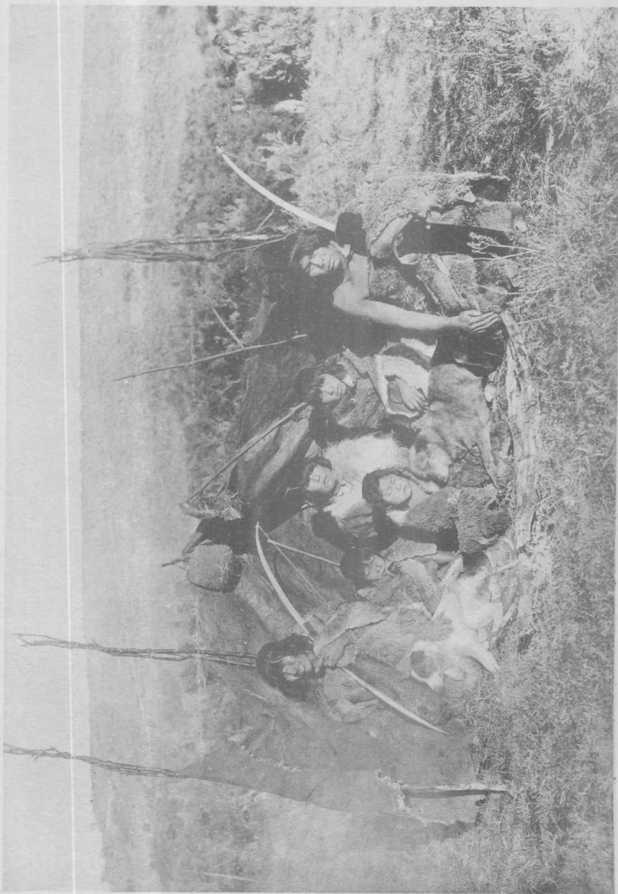
Groupe d'Indiens Ona aux environs de Useless Bay, Terre de Feu (Nord)