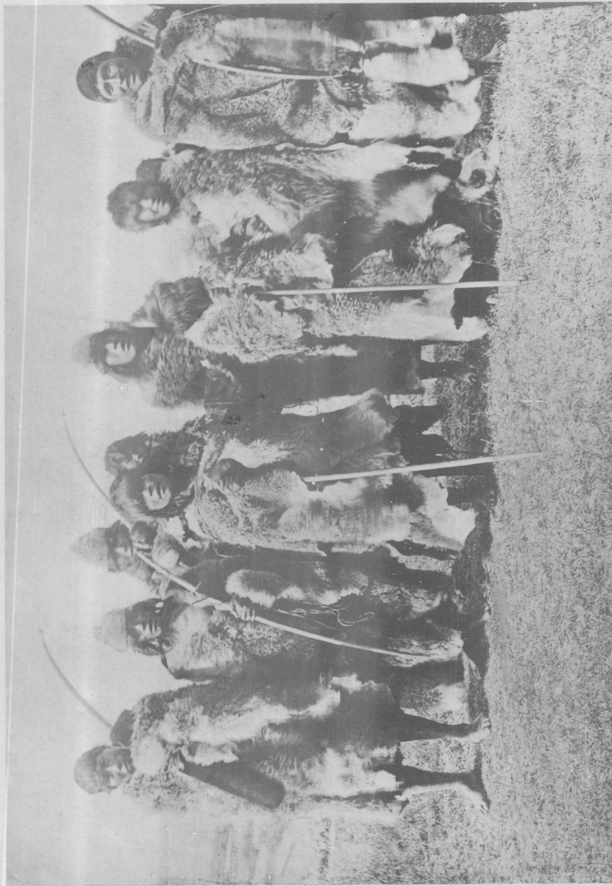
Groupe d'Indiens Ona aux environs de Harberton, Terre de Feu (Sud)