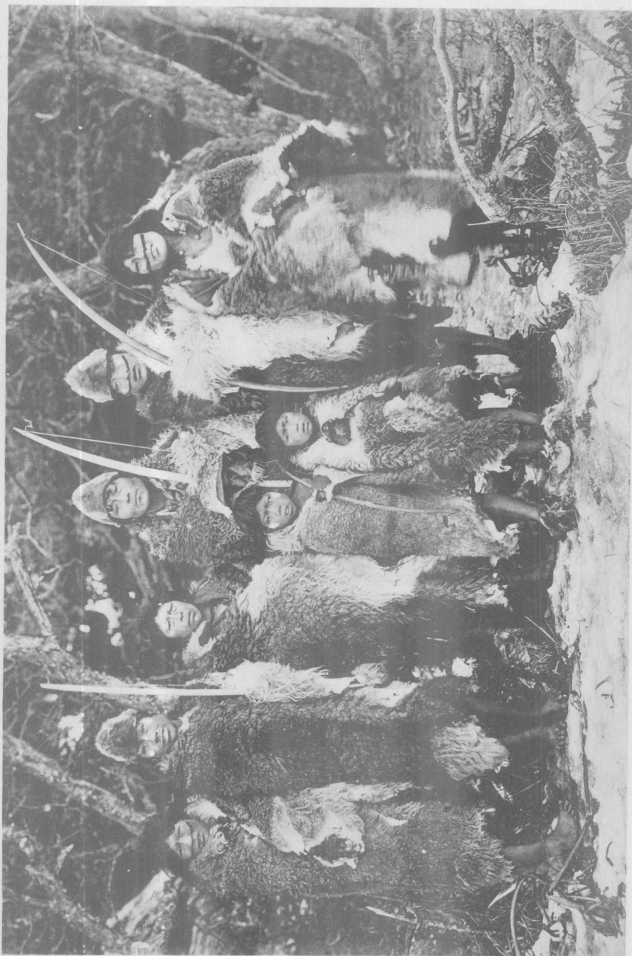
Groupe d'Indiens Ona aux environs de Harberton, Terre de Feu (Sud)