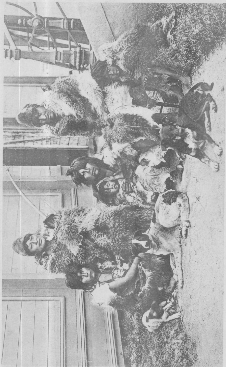
Grupo d'Indiens Ona dans l'Exposition Nationale de Buenos Aires 1898