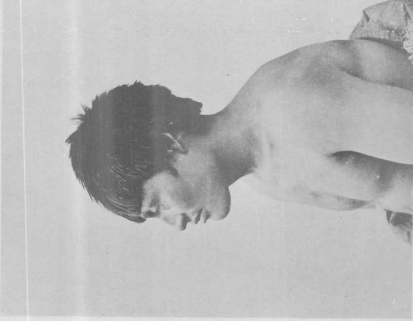
« Kiofemen »