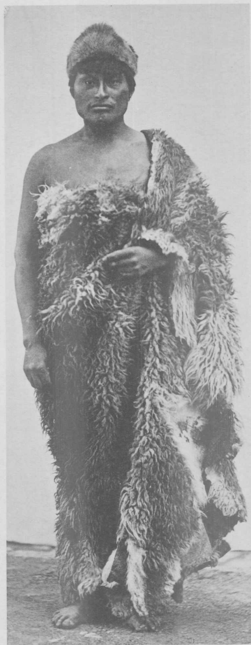
« Tchoskiái »