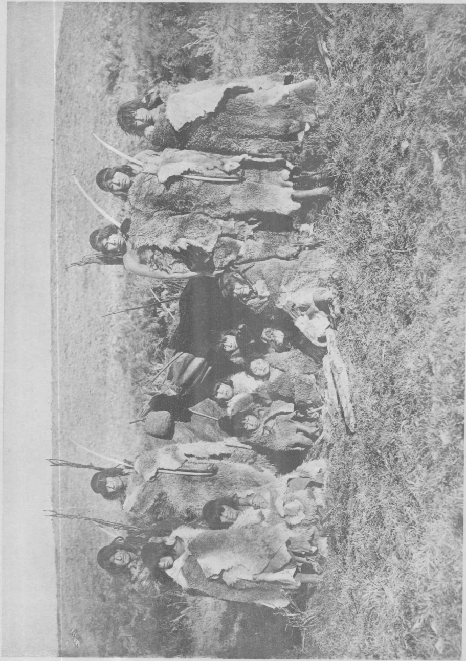
Groupe d'Indiens Ona aux environs de Useless Bay, Terre de Feu (Nord)