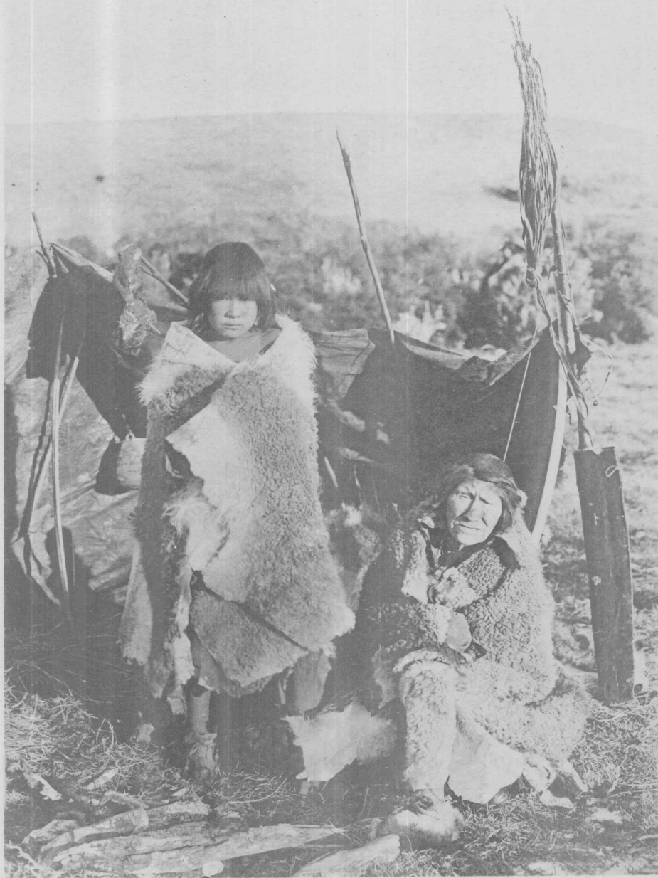
Femmes Ona aux environs de Useless Bay, Terre de Feu (Nord)