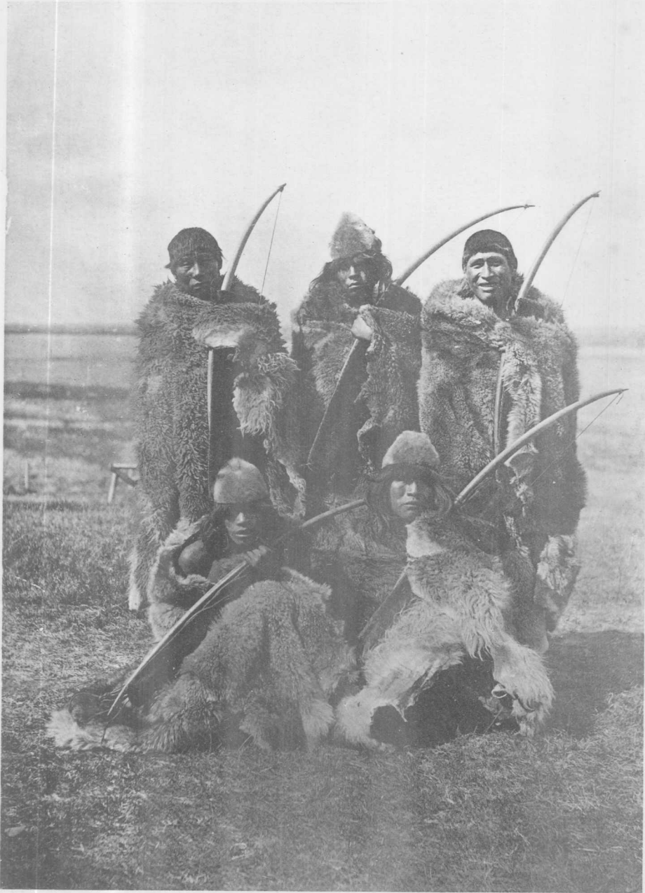
Groupe d'Indiens Ona aux environs de Harberton, Terre de Feu (Sud)