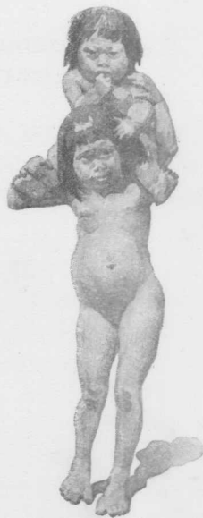
Fig. 1. — Niño mataco llevando al hermanito menor; las dos estrellas ζ 1 y ζ 2 Scorpii , comparadas con dos niños en esta posición, son llamadas « El Nieto » (ver el texto).

Los indios ven en las dos estrellas, ζ 1 y ζ 2 Scorpii , dos niños, de los cuales el mayor lleva al menor sentado en sus hombros, de tal modo que las piernas del último,