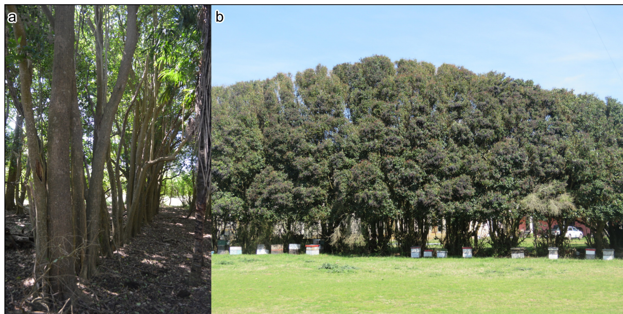
Figura 5: El uso de los árboles para la delimitación de los espacios puede verse en estos cerco vivo de ligustros ( Ligustrum lucidum ) en el sector de la quinta (A) y como delimitador del cuadro principal (B). Este último es el que corresponde al cerco de la Figura 4.

Actualmente se puede observar en las inmediaciones de la casa principal, árboles ornamentales como cedros, palmeras y magnolias, utilizados por sus fines estéticos. También, detrás de la casa, se desarrolla una zona de árboles frutales, el cual se continúa por una hilera de casuarinas y un monte de eucaliptos colorados. De este último, se extrae leña para el uso doméstico de la estancia. Este establecimiento se dedica a la cría de hacienda y a la producción de miel. Para alimentación del ganado vacuno, en la actualidad se utilizan pasturas naturales, si bien en algún momento se han utilizado pasturas de alfalfa. Las colmenas se distribuyen en distintos sectores del campo, cercanos a los árboles que ofrecen sus flores. El zumbido de las abejas en determinados sectores resulta muy llamativo.