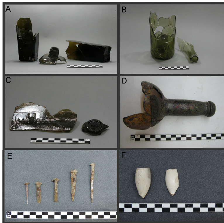
Figura 2. Materiales arqueológicos recuperados en el sitio El Santuario I. A) Botellas base cuadrada. B) Botella cilíndrica. C) Detalle de la marca "v Hoytema & C" y sello "Van den Berg". D) Pico y hombro de botella cilíndrica color ámbar rojo, con inscripción "J.T. Gayen". E) Clavos de sección cuadrangular. F) Cazuelas de pipas de caolín.

En este sentido, la propietaria actual del campo recuerda que en su infancia, en la década del '50, la carnicería (a unos 50 metros de la casa principal), "estaba todo con mosquitero. Ahí lo mataban y dejaban hasta que tenga el rigor mortis . En esa época, papá mandaba a carnear una oveja. A los puesteros y peones les llevaban carne y les daban. En ese momento la estancia tenía un puesto solo, poco personal". De esta forma, se vislumbra como varias décadas después el mecanismo de carnear y distribuir desde el casco de la estancia sigue en vigencia, aunque con algunos cambios debidos a la escala del establecimiento. También recuerda de su niñez que a veces en el fogón de los peones se