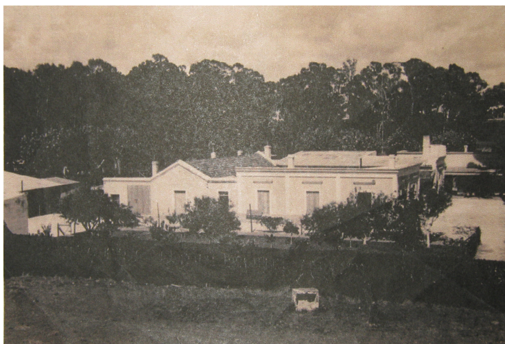
Figura 4. Casco de la Primera Estancia en la década del '50 del siglo XX, visto desde el sector de los peones. Se pueden ver las construcciones principales, árboles frutales en el parque y el cerco vivo de delimitación del cuadro.

En la distribución actual de los espacios de la estancia, se pueden ver –en concordancia con las prescripciones de los manuales analizados- la jerarquización y separación de los espacios destinados a los distintos actores, incluso la rigidez de las vías de circulación habilitadas o impedidas. El paso del tiempo y la falta de mantenimiento de los cercos y alambrados han hecho que se desarrollen vías de comunicación alternativas a las previamente estipuladas.