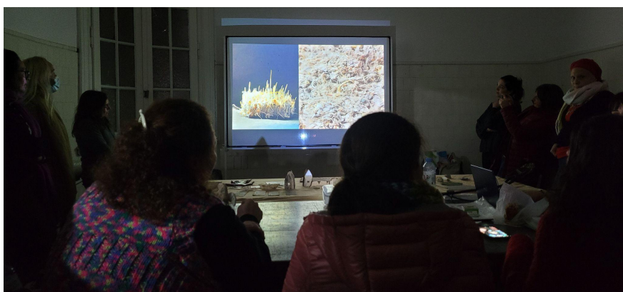
Figura 1. Evaluación de experiencias realizadas, Seminario Relación Materia y Temperatura. Especialización en Cerámica Gráfica Contemporánea, Cohorte 1 y 2, 2022.

El espacio del seminario de Relación materia y temperatura propone como líneas de investigación el desarrollo de prácticas experimentales de cuerpos cerámicos (cuerpos autofraguantes, con incorporación de materiales orgánicos, cuerpos porosos, cuerpos vítreos), superficies (térreas, vítreas, superficies mixtas), tensiones entre cuerpo y superficie (vínculos, lo compacto / lo poroso, lo crudo / lo cocido), la composición de tintas gráficas (lo orgánico-lo inorgánico: medio, materia y color), la adaptación para estampar en distintos soportes, la adaptación y características de soportes para estampar.