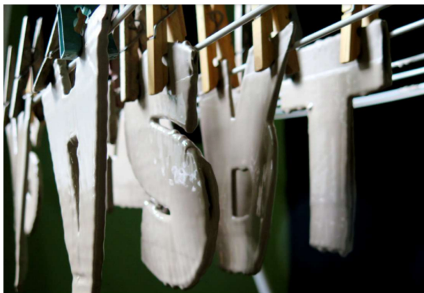
Figura 3. Registro de experiencia desarrollada por Andreassi, D. Martínez Fernández de Madero, G. Roca, C. Seminario Relación Materia y Temperatura, Especialización en Cerámica Gráfica Contemporánea, 2022.

cualidad que ayude a elaborar un concepto. Podemos decir que se puede obtener una pasta que emula al papel o cartón en sus cualidades físicas y simbólicas para plasmar un lenguaje plástico.” 1