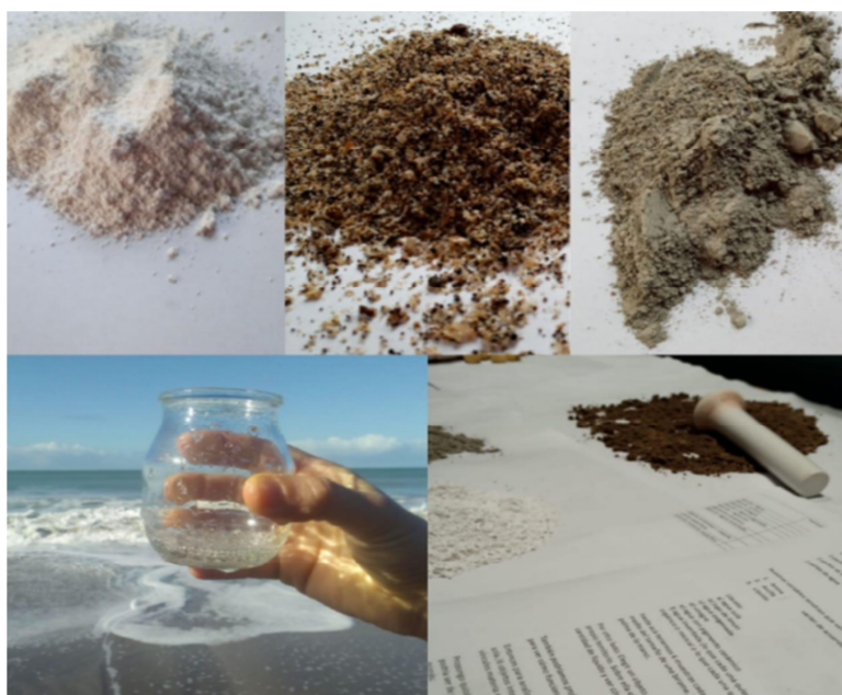
Figura 4. Registro de experiencia desarrollada por Carli, V., Gómez, A., Hernández, A., Mozzi, A., Romero De Medina, A. & Rusconi, M. Seminario Relación Materia y Temperatura, Especialización en Cerámica Gráfica Contemporánea, 2022.

Se planteó la posibilidad de crear un registro sensible vinculando las experiencias personales, los territorios y las posibles interacciones entre estos en un proyecto titulado Cartografía Subjetivas , proyecto de exploración matérica, poética y sensible. Este colectivo se pregunta "¿Qué pasa con la materia autofraguante cuando entra en contacto con otros cuerpos en un ambiente determinado? ¿Cómo nos interpela a nosotras este intercambio de aproximaciones personales y colectivas?" El desarrollo de la experiencia en este caso puntual se constituye en la construcción de un método de indagación sobre los propios orígenes y las derivas de los territorios que habitan nuestro quehacer como artistas – ceramistas. En sus palabras: "Este pequeño hallazgo que surge de nuestras experimentaciones sin que nadie pudiera imaginarlo, se nos presenta como un gesto, sutil y contundente de la naturaleza que sin tapujos rompe aquello que la constreñía. Devela la belleza de todo lo ocurrido a lo largo de los meses de encuentros. (...) Revisando los desplazamientos, arribos y desvíos, el mapa comienza a delinearse ante todo como un territorio colectivo, donde los límites ya no separan, sino que encuentran y cada elemento, diálogo e historia ofrecidos nos aproxima un tanto más. Entendemos este mapeo afectivo como un itinerario que nos posibilita ir al encuentro con otros, sabiendo que al volver ya no seremos las mismas." 6