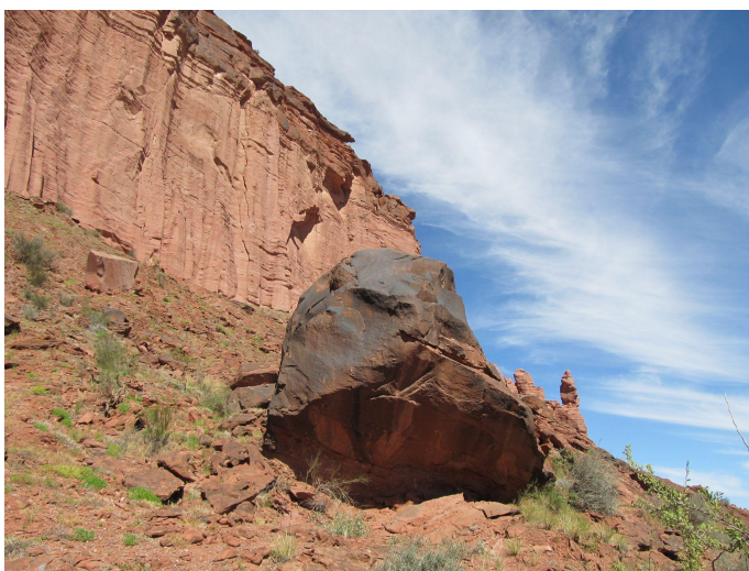
Figura 16. Vista general del sitio Puerta de Talampaya.

Si bien este sitio está siendo estudiado sistemáticamente, las cerámicas recuperadas aún están en proceso, por lo que nos limitaremos a los que se localizaron en los depósitos del museo de la UNLaR. En dicha institución, los materiales están identificados con distintos topónimos que consideramos en conjunto dado su bajo número.