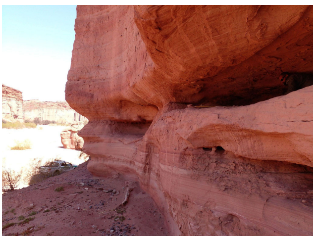
Figura 8. Sitio Las Cuchillas.

El material disponible se encuentra en el Museo de la UNLaR e incluye tres fragmentos cerámicos que conforman una olla cerrada de pasta gris claro y decoración incisa de largas líneas verticales en la cara externa, que determinan campos ocupados por pares de líneas paralelas cortas siguiendo un patrón rítmico sobre la superficie alisada, también de color claro (Fig. 9). Este tipo de decoración es compatible con los patrones y técnicas característicos de la cerámica temprana y, sumada a la cocción reductora gris y la pasta compacta con inclusiones muy pequeñas de cuarzo, podría identificarse como un Ciénaga temprano. El resto del material cerámico no es significativo, al constituir pequeños fragmentos de cocción variada y escasas inclusiones de naturaleza mineral, sin decoración y con las superficies exteriores alisadas en seco y las interiores en húmedo, una característica muy frecuente en la mayoría de los sitios del PNTA.