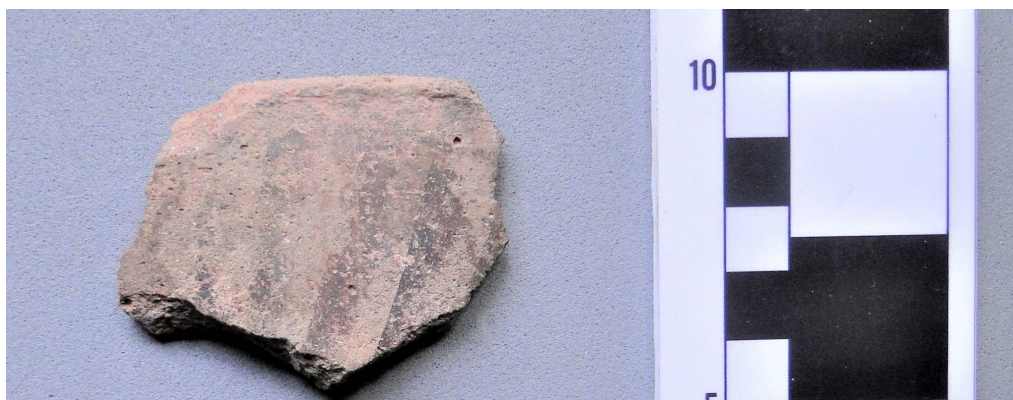
Figura 3. Fragmento cerámico de Las Cañitas