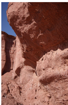
Figura 2. Sitio Las Cañitas.

En cuanto a la cerámica, se trata de dos fragmentos de cerámicas globulares de formas abiertas que fueron recolectados en superficie, ya que la excavación realizada no descubrió nuevos fragmentos. Uno de ellos presenta textura de pastas muy compacta, con abundante antiplástico inorgánico de tamaño fino y forma redondeado, fundamentalmente cuarzo, compatible con el registro de cronologías tempranas en sitios de la zona (Carosio et al. , 2019). Respecto a la decoración, se ha identificado un fragmento de borde correspondiente al estilo Ciénaga pintado con líneas negras finas sobre superficie ante en la cara externa (Fig. 3). El segundo tiesto se identifica con decoración Sanagasta-Angualasto en negativo negro sobre ante también sobre la superficie externa (Revuelta et al. , 2010-2011). Composicionalmente se identifica una variedad rocosa redondeada de tamaños finos, con presencia de cuarzo.