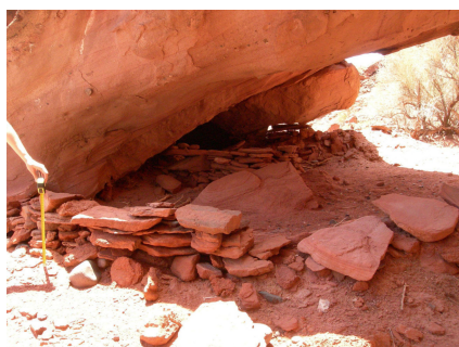
Figura 4. Quebrada don Eduardo.

No hay anotaciones que permitan separar el material de excavación del superficial, por lo que consideraremos los 57 fragmentos en su conjunto. La cerámica gris sin decoración que menciona Gonaldi no corresponde, como podría pensarse por las características de otros sitios del PNTA, a fragmentos Ciénaga; por el contrario, presentan una composición disgregable de granulometría heterogénea, con abundantes inclusiones de cuarzo, rocas varias y material orgánico. Además, el recipiente posee paredes gruesas, curvatura compatible con una forma abierta de tamaño mediano (ca. 30-35 cm) y cocción oxidante incompleta. Asociado a este material se conservan dos tiestos que corresponde tipológicamente a la decoración Sanagasta-Angualasto (Revuelta et al. , 2010-2011), con características tecnológicas similares: uno de ellos está decorado con las típicas bandas gruesas verticales festoneadas ( sensu Serrano, 1943) y el otro presenta líneas en zigzag de pintura negra sobre superficie roja desleída (Fig. 5).