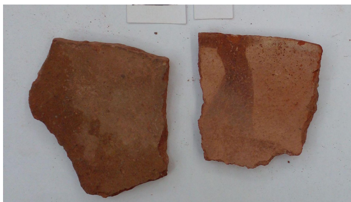
Figura 7. Fragmentos cerámicos de Aguas Arriba.