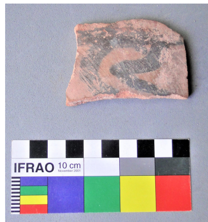
Figura 11. Fragmento cerámico de El Bosquecillo.