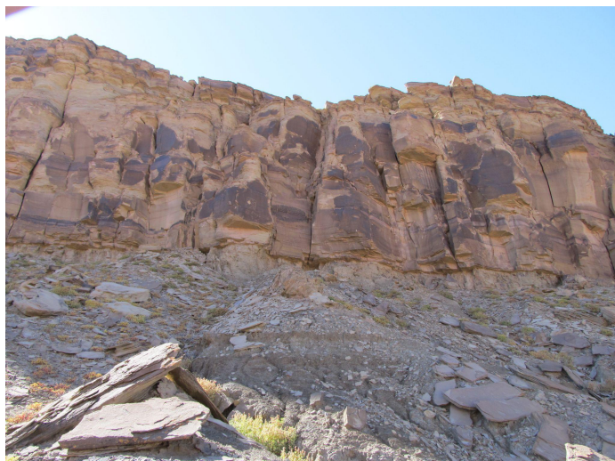
Figura 12. Sitio arqueológico Los Chañares.

La cerámica, un total de 56 tiestos y un tortero, no presenta decoración alguna ni formas identificables, si bien parece responder a recipientes abiertos de tamaño mediano, con un diámetro máximo de 20cm. Por sus características tecnológicas definidas por la pasta compacta color gris oscuro-negro, con escasas inclusiones minerales visibles macroscópicamente, entre las que destaca el cuarzo redondeado, y superficies alisadas en seco en el exterior y en húmedo en el interior, podría corresponder a una cronología temprana. Junto a este material se recolectó un tortero recortado de un fragmento de material similar al resto del conjunto (Fig. 13).