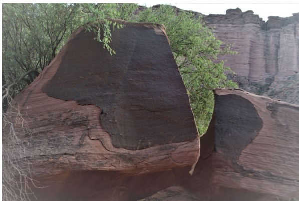
Figura 6. Sitio Aguas Arriba.

básicamente cuarzo redondeado pero con presencia anecdótica de restos carbonizados en seis fragmentos, cocciones reductoras y acabados alisados.