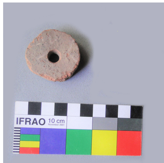
Figura 13. Tortero cerámico de Los Chañares.