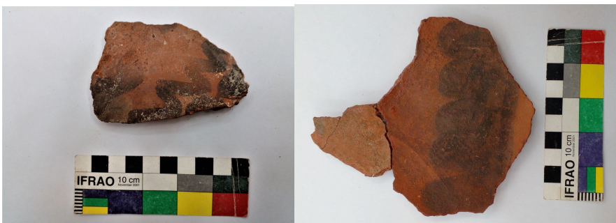
Figura 5. Fragmentos cerámicos de Quebrada don Eduardo.