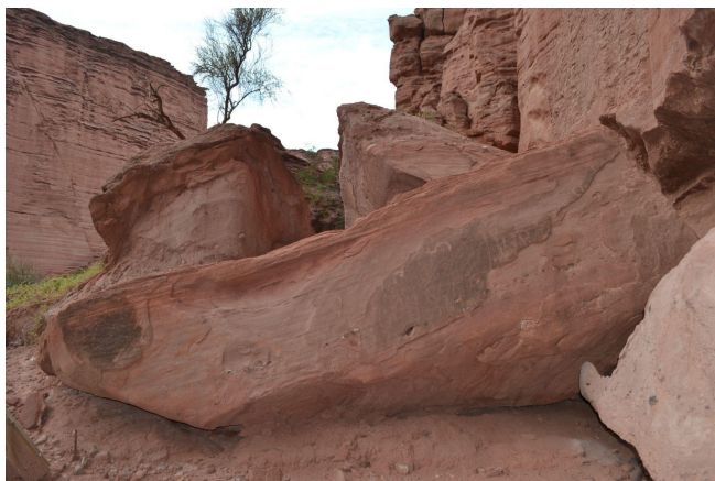
Figura 10. Sitio arqueológico El Bosquecillo.

Sólo se cuenta con un fragmento recogido en una prospección superficial con decoración negro sobre ante sobre la cara externa alisadas típica del estilo Sanagasta-Angualasto (Fig. 11). Corresponde a un recipiente abierto de tamaño mediano debido a la escasa curvatura que presenta.