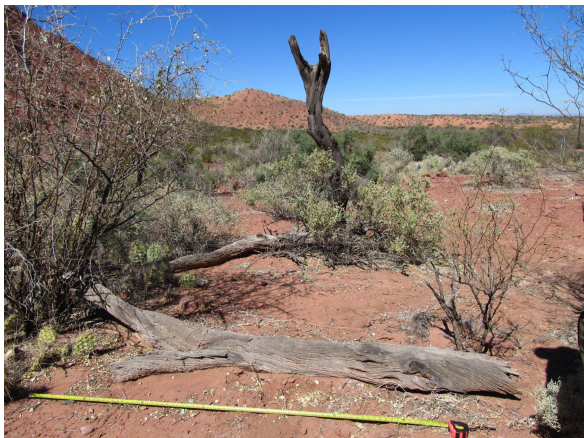
Figura 14. Sitio El Dintel.

Se trata de un sitio al aire libre fuera del río Talampaya (Fig. 14) caracterizado por la presencia de pequeñas concentraciones de material lítico tallado y pulido y cinco fragmentos cerámicos, uno de ellos con engobe negro, y pastas con abundante antiplástico inorgánico de rocas variadas y cuarzo, y otro con un posible motivo pintado en la cara externa de líneas gruesas negras sobre engobe rojo, que podría adscribirse al período tardío por su afinidad con la cerámica Sanagasta-Angualasto. Todo el material tiene superficies alisadas en seco, bastante deterioradas por la erosión. No es posible identificar formas por el reducido tamaño de los fragmentos y la ausencia de elementos significativos.