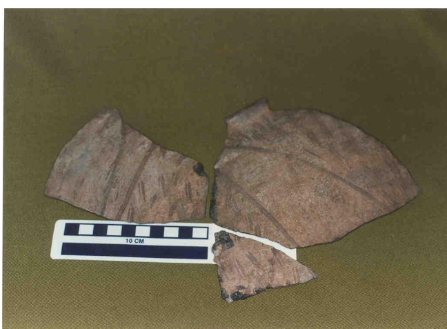
Figura 9. Cerámica de Las Cuchillas.