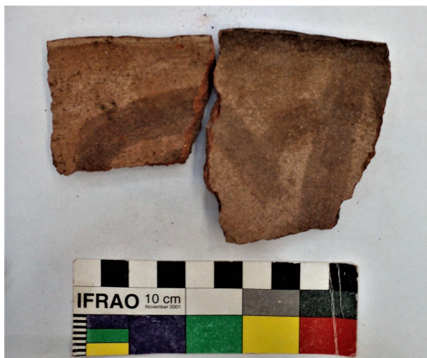
Figura 17. Fragmento de borde de Puerta de Talampaya.